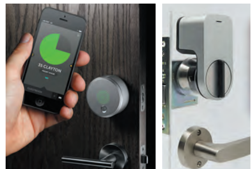
新たなスマートロック方式