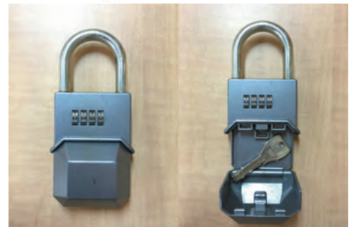
現地に設置してあるキーボックス